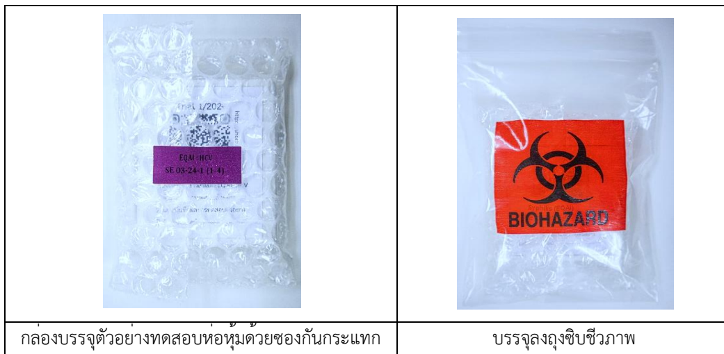
รูปที่ 1 แสดงตัวอย่างสำหรับการทดสอบไวรัสตับอักเสบซี ซีโรโลยี

ตัวอย่างที่เตรียมในทุกรอบการส่งได้ผ่านการทดสอบความเป็นเนื้อเดียวกัน (Homogeneity) ก่อนส่งตัวอย่างให้สมาชิกและการทดสอบความคงตัวของตัวอย่าง (Stability) ซึ่งตัวอย่างที่ไม่ผ่านการทดสอบความเป็นเนื้อเดียวกัน และการทดสอบความคงตัวของตัวอย่างจะไม่ได้ถูกนำมาประเมิน